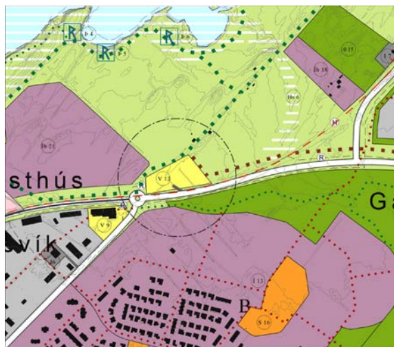
Mynd 2: Drög að afmörkun svæðis fyrir verslun og þjónustu