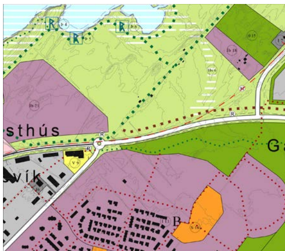
Mynd 1: Gildandi aðalskipulag.

Í fyrirhugaðri breytingu felst að skilgreindur verður nýr 1,6 ha landnotkunarreitur fyrir verslun og þjónustu, þ.e. bensínstöð, bílaþjónustu og upplýsingasvæði, norðan Akranesvegjar og austan hringtorgs við Þjóðbraut. Færa þarf hluta Þjóðbrautar til norðurs og aðlaga reið- og göngustíga að nýrri lóð. Gert verður ráð fyrir aðrein úr austri inn á lóðina af Akranesvegji. Mörkum íbúðarsvæðis norðan Akranesvegjar, svæðis Íb-21 verður breytt lítillga.